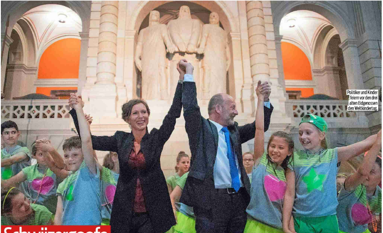
Politiker und Kinder feiern vor den drei alten Eidgenossen den Weltkindertag.