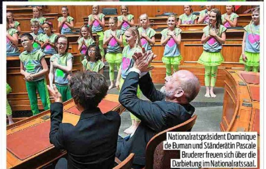
Nationalratspräsident Dominique de Buman und Ständerätin Pascale Bruderer freuen sich über die Darbietung im Nationalratsaal.