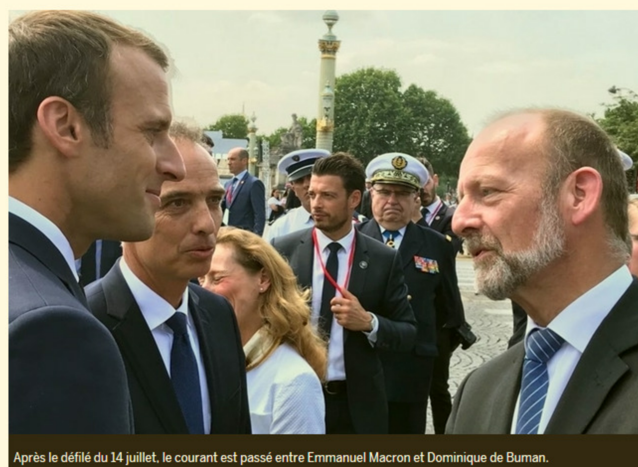
Après le défilé du 14 juillet, le courant est passé entre Emmanuel Macron et Dominique de Buman.

Le président du Conseil national helvétique, Dominique de Buman, se souviendra longtemps du 14 juillet 2018, et de sa rencontre avec Emmanuel Macron.